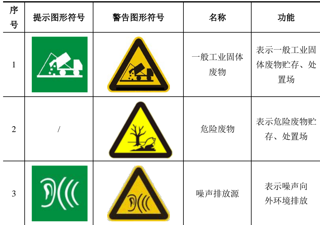
表 4-10 环境保护图形标志的形状及颜色表