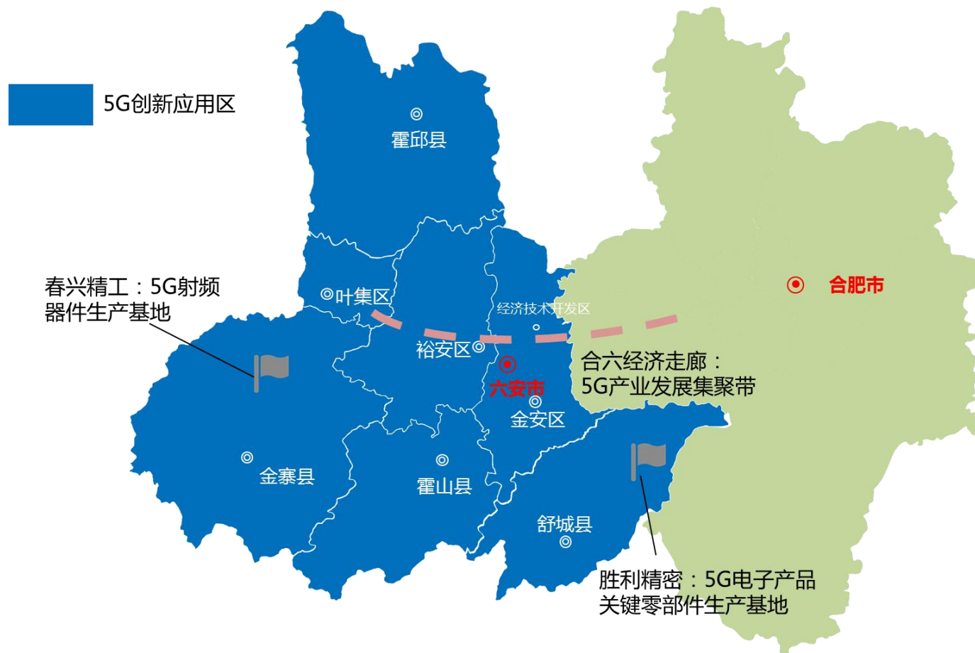
附件 5：六安市 5G 产业空间布局图