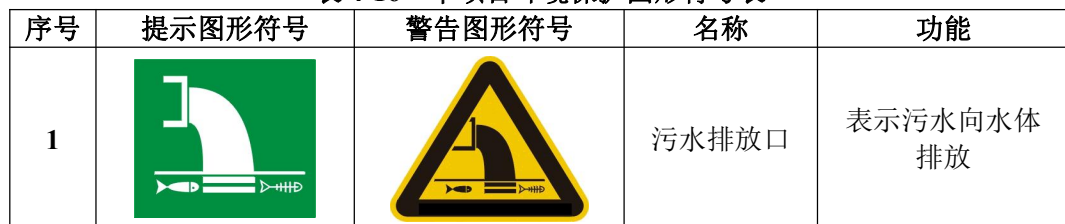
表 4-16 本项目环境保护图形符号表

(5) 危险废物贮存设施必须按照《环境保护图形标志固体废物贮存(处置)场》(GB15562.2-1995)的规定设置警示标志。危险废物贮存设施周围应设置围墙或其他防护栅栏，配备通讯设备、照明设施、安全防护服装及工具，并设有应急防护设施。环境保护图形符号及环境保护图形标志的形状和颜色分别见下表。